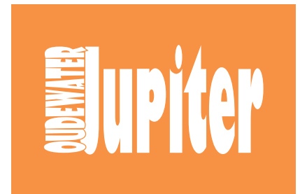
Logo diapositief op oranje